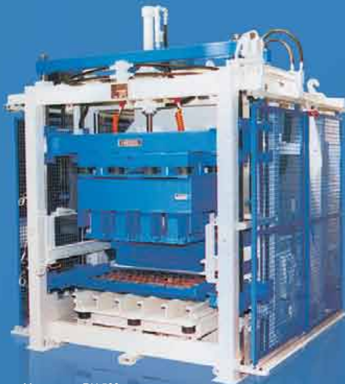
Мультимат RH 500

Мультимат RH 500 - это очень компактная машина универсального применения для изготовления бортовых камней, тротуарной плитки, пустотелых блоков и подобных бетонных элементов. Поставляется как в полуавтоматическом, так и в автоматическом исполнении.