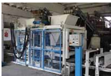
RH 500 вид сбоку