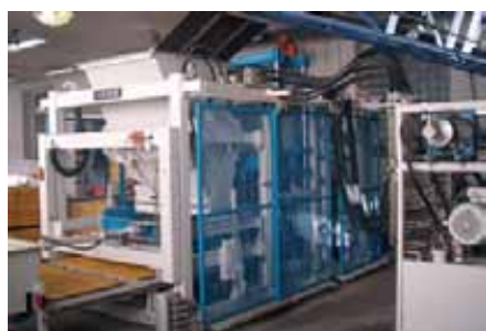
RH 500 с гидростанцией