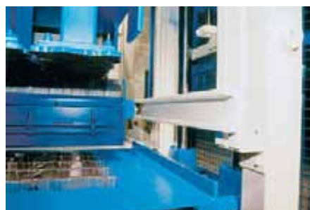
Стабильные, незагрязняемые ролики трансферкары